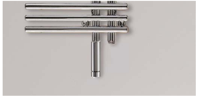
Ausführung Elektrobetrieb mit eingebautem Heizstab WIVAR II

V20191124, RAD_DAS, DE_de, Änderungen vorbehalten