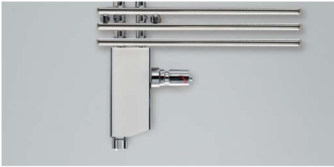
Anschluss-Armatur mit Blende in Chrom für Ausführung Mixbetrieb.